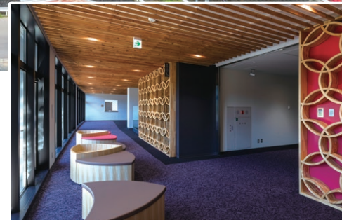
5階 議会フロアのホワイエ