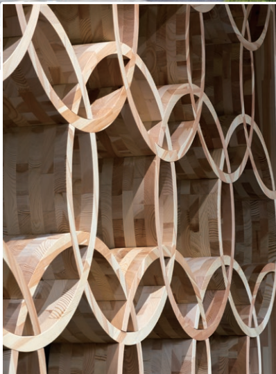
町産カラマツを使用したデザインウォール