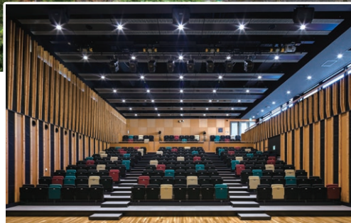
2階 多目的ホール「まき×まきホール」